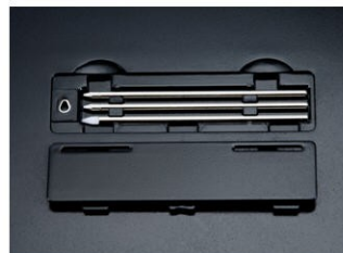
Compartiment de réserves de mines : 2 mines encre + une mine plastique pour la fonction tablette PC.